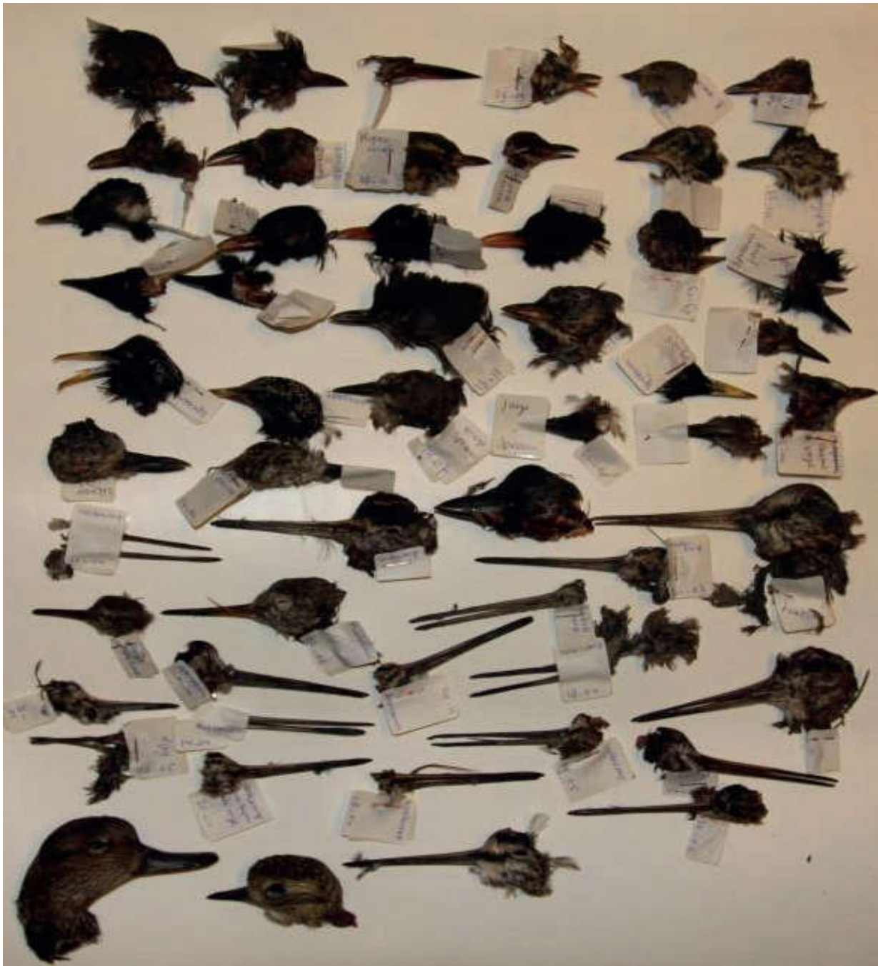
Foto 7. Koppen en snavels van prooien van Slechtvalken op de Lange Jan in Middelburg. Heads and bills of prey of Peregrines staying at Lange Jan in Middelburg.

Veel prooiresten zijn gefotografeerd. Alle ruim 360 resten zijn gedetermineerd (via www.michelklemann.nl/verensite/start/ en www.featherbase.info/nl/home ). Snel werd duidelijk dat het hier niet ging om het daadwerkelijke aantal prooien. De ene dag kon een kop gevonden worden, de volgende dag het daarbij behorende karkas, de vleugels of de poten. In het clusteren van individuele prooiresten zijn wij onervaren. Alle losse koppen en ‘hele’ vogels werden genoteerd. Losse veren, koppen en poten die bij elkaar leken te horen werden vervolgens geclusterd (Foto 6 en 7).