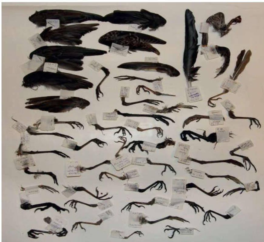
Foto 6. Prooi-resten gevonden in 2017; een deel van vleugels en poten van de gevonden resten is bewaard en dient als referentiecollectie. Prey remains of Peregrines staying at Lange Jan in Middelburg, collected in 2017; many wings and legs were saved and used as reference material.