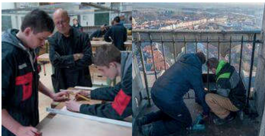
Foto 2 en 3. Bouw en plaatsing van de nestbak, dat laatste op 20 november 2013. Production of nestbox and its placement on the abbey tower in Middelburg on 20 November 2013.

de nestbak steeds leeg. Op 27 juni werd een roepend jong gehoord en op 13 juli een heel luidruchtig exemplaar. De waarnemer zag duidelijk de bruinige rug en vleugels. 5 Het is als een succesvol jaar te beschouwen, maar de nestlocatie bleef wederom onbekend.