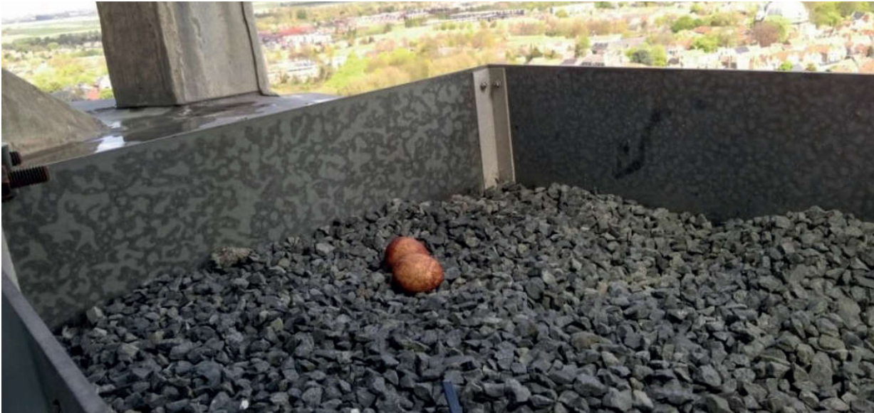
Foto 4. Nestbak met eieren, Lange Jan in Middelburg, 25 april 2017. Two Peregrine eggs in nestbox of Lange Jan in Middelburg, 25 April 2017.

vloedig aanwezig en werden dagelijks verzameld en gefotografeerd. Vervolgens werden zij maandelijks gedetermineerd. De hoeveelheid loog er niet om (zie de overzichten en grafieken in dit artikel). Op 25 april klom weer een van de waarnemers omhoog en trof in de nestbak twee eieren (Foto 4).