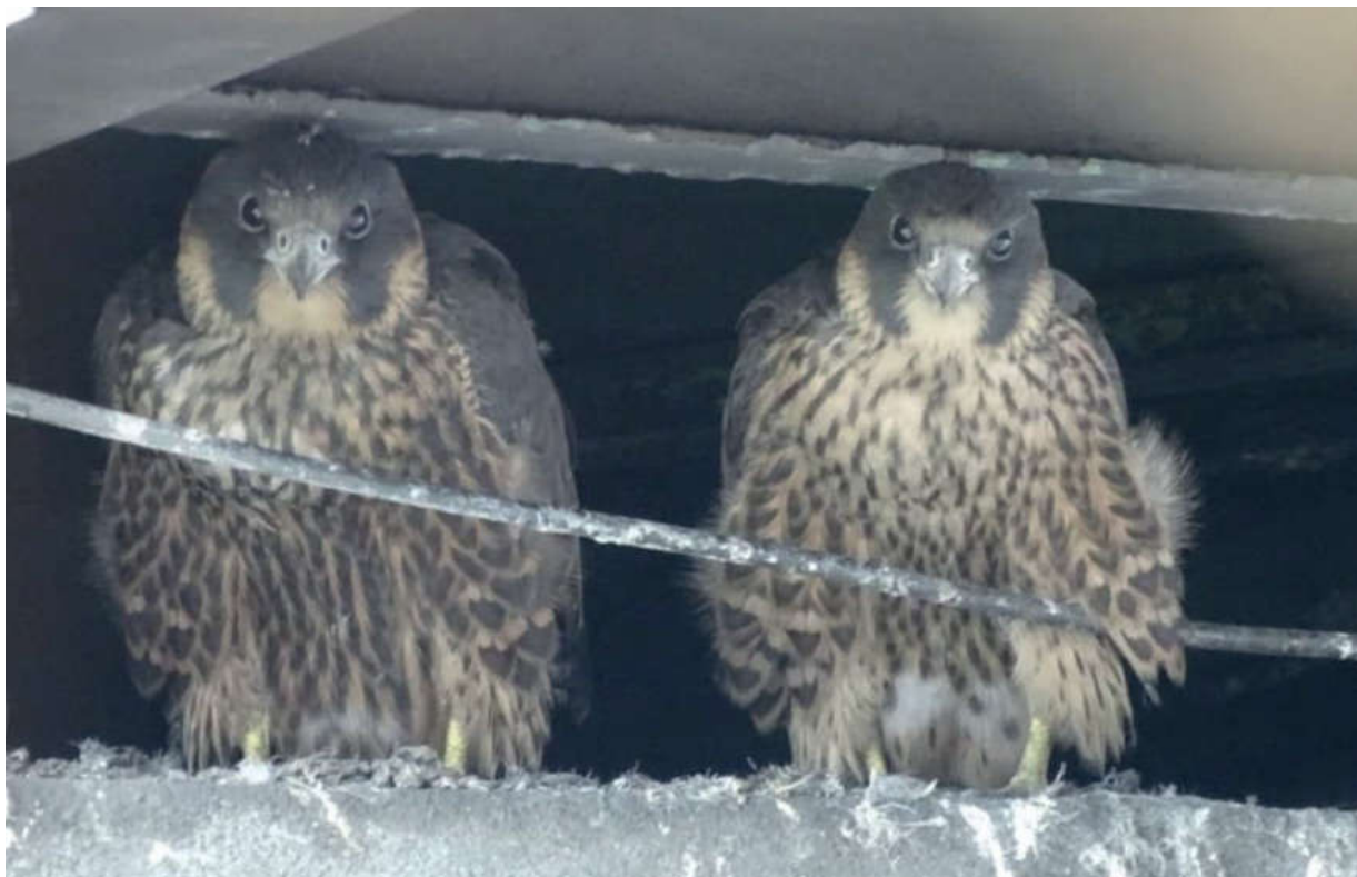
Foto 1. Twee van de drie jonge Slechtvalken op de rand van het nest, Thermphos 11 juli 2014. Two of three fledgling Peregrines on the nest rim, Thermphos, 11 July 2014.

Het jaar 2014 was een absoluut hoogtepunt wat de Slechtvalk op Walcheren betreft. Er werd een nest ontdekt in een toren van het inmiddels failliete Thermphos, de buiten gebruik gestelde fosfaatfabriek in het industriegebied bij Vlissingen. Pas in een laat stadium raakten roofvogelaars bij dit nest betrokken. Toen zaten er al twee juvenielen naar buiten te kijken op de nestrand (Foto 1); een derde zat in een andere nis, iets lager dan het nest. De ouders waren geringd maar het is niet gelukt om de ringen goed af te lezen.