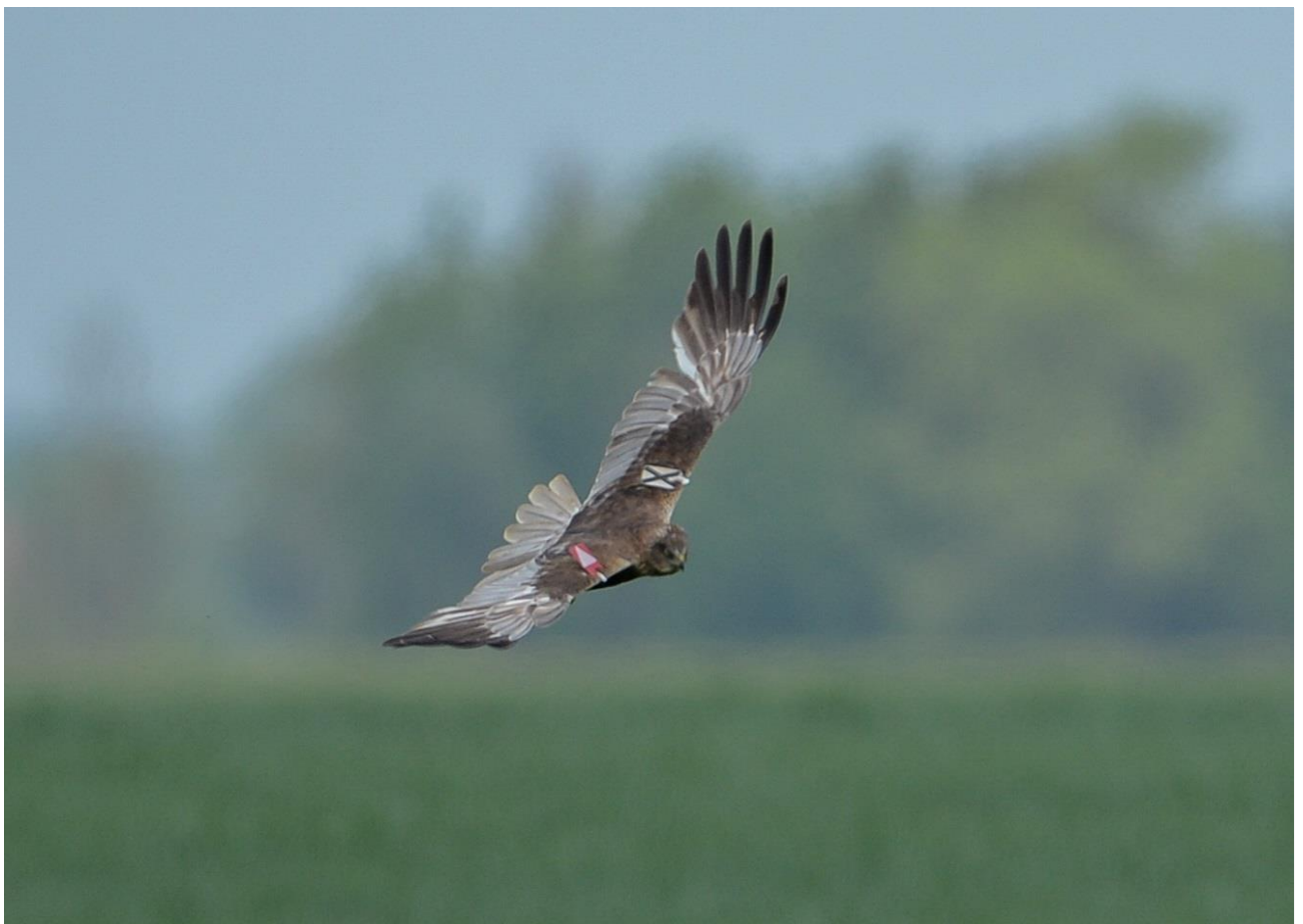
Bruine kiekendief met vleugelmerken.